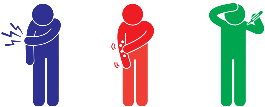
Ցավ/Կարմրածություն Թեթևակի ցան Մեղմ դողերոցք

Որոշ մարդկանց մոտ ներարկումները ստանալուց հետո կարող են առաջանալ հազվադեպ հանդիպող, վատ կողմնակի ազդեցություններ: Ավելի հաճախ դրանք անցնում են ներարկումը ստանալուց մի քանի րոպե կամ մի քանի ժամ հետո: