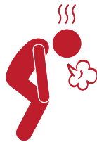
Ua Pa Nyuab

Tej txhia neeg kuaj muaj cov mob tshwm sim txawv, phem heev tom qab tau cov koob txhaj tshuaj. Feem ntau, lawv yuav tshwm sim tom qab ob peb feeb lossis ob peb xuab moos tom qab koj tau cov koob txhaj tshuaj.