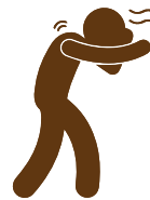
Qaug Qaug Ncig Leeg