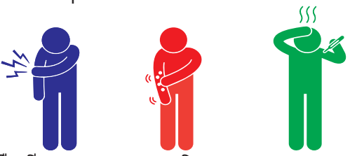
ឈឺ/ឡើងក្រហម កន្ទួលបន្តិចបន្តួច គ្រុនស្រាល

មនុស្សខ្លះក៏មានប្រតិកម្មបន្ទាប់បន្សំអាក្រក់ បន្ទាប់ពីគេបានចាក់ថ្នាំបង្ការ។ ភាគច្រើននៃពេល វានឹងកើតឡើងក្នុងពេលពីរបីនាទី ឬពីរម៉ោងបន្ទាប់ពីបានចាក់ថ្នាំបង្ការ។