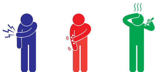
Ból/Zaczerwienienie Niewielka wysypka Lekka gorączka

Niektórzy ludzie mają niewielkie skutki uboczne po otrzymaniu zastrzyków. Te powinny odejść po dniu lub dwóch.