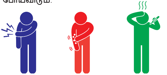
வலி/சிவந்தன்மை லேசான தடிப்பு மிதமான காய்ச்சல்

சிலருக்கு மருந்து செலுத்தப்பட்டதும் சிறு பக்க விளைவுகள் ஏற்படும். அவை ஒன்று அல்லது இரண்டு நாட்களில் போய்விடும்.