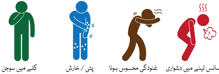
گلے میں سوجن

کچھ لوگوں کو اپنے شائٹس لینے کے بعد معمولی ضمنی اثرات ہوتے ہیں۔ یہ ایک یا دو دن میں ختم ہوجانے چاہئیں۔