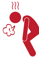
مشکل در تنفس