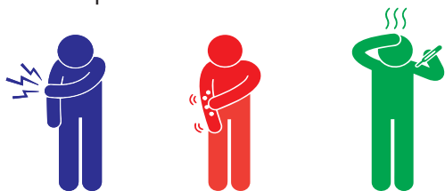
ឈឺ/ឡើងក្រហម កន្ទួលបន្តិចបន្តួច គ្រុនស្រាល

មនុស្សខ្លះក៏មានប្រតិកម្មបន្ទាប់បន្សំអាក្រក់ បន្ទាប់ពីគេបានចាក់ថ្នាំបង្ការ។ ភាគច្រើននៃពេល វានឹងកើតឡើងក្នុងពេលពីរបីនាទី ឬពីរម៉ោងបន្ទាប់ពីបានចាក់ថ្នាំបង្ការ។