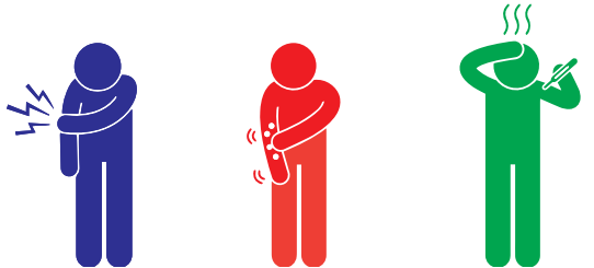
Xanuun/Casaan Finan Yar yar Xumad Degen

Dadka qaar waxay yeeshaan saamayn tabban oo yar ka dib markay qaataan mudditaankooda. Tani waxay ku tagtaa maalin ama labba.